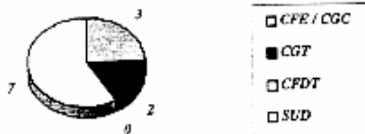
Représentants du personnel à Aubevoye (en membres)